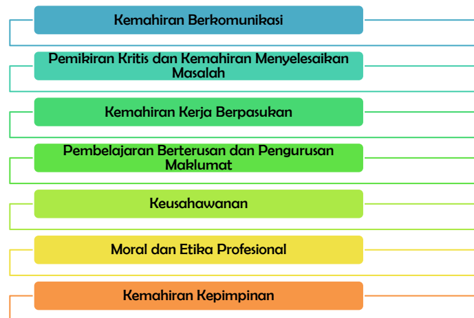
Rajah 1 Tujuh elemen kemahiran insaniah yang telah digariskan oleh Kementerian Pendidikan Malaysia (KPTM)

Dalam menerapkan kemahiran insaniah dalam aktiviti kokurikulum yang dijalankan di Universiti Awam, pihak KPTM telah mengkategorikan aktiviti-aktiviti kokurikulum kepada lapan teras utama bagi aktiviti-aktiviti kokurikulum seperti gambar rajah berikut: